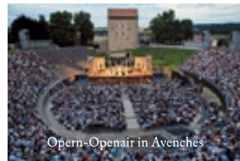
Opern-Openair in Avenches

sind. Die musikalische Ausformung und Überzeichnung dieser Gefühlszustände ist schliesslich auch das, was die Zuschauer in den Bann zieht. Das Libretto von «Lucia di Lammermoor» nur zu lesen, wäre wohl langweilig. Wie nahe sind Wahnsinn und Kunst miteinander verwandt? Auf der Bühne arbeiten sie oft zusammen: Hier die wahnsinnige Person, die