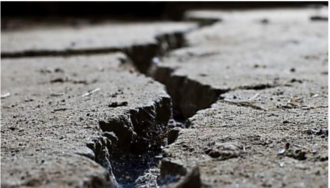
Terremoti in Svizzera: «un rischio cumulativo per le grandi aziende» Allianz