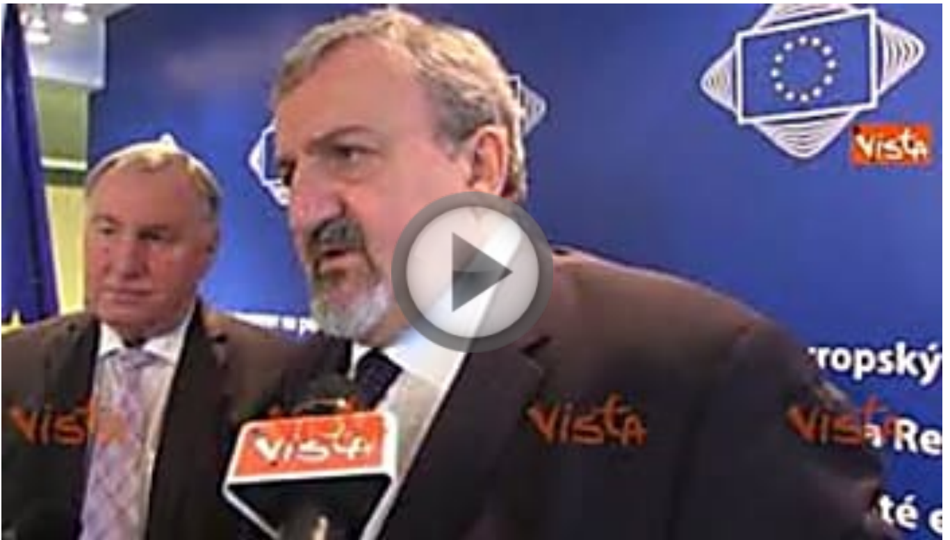
Emiliano: acquedotto dall'Albania alla Puglia sul percorso del Tap, ne ho parlato con Blair