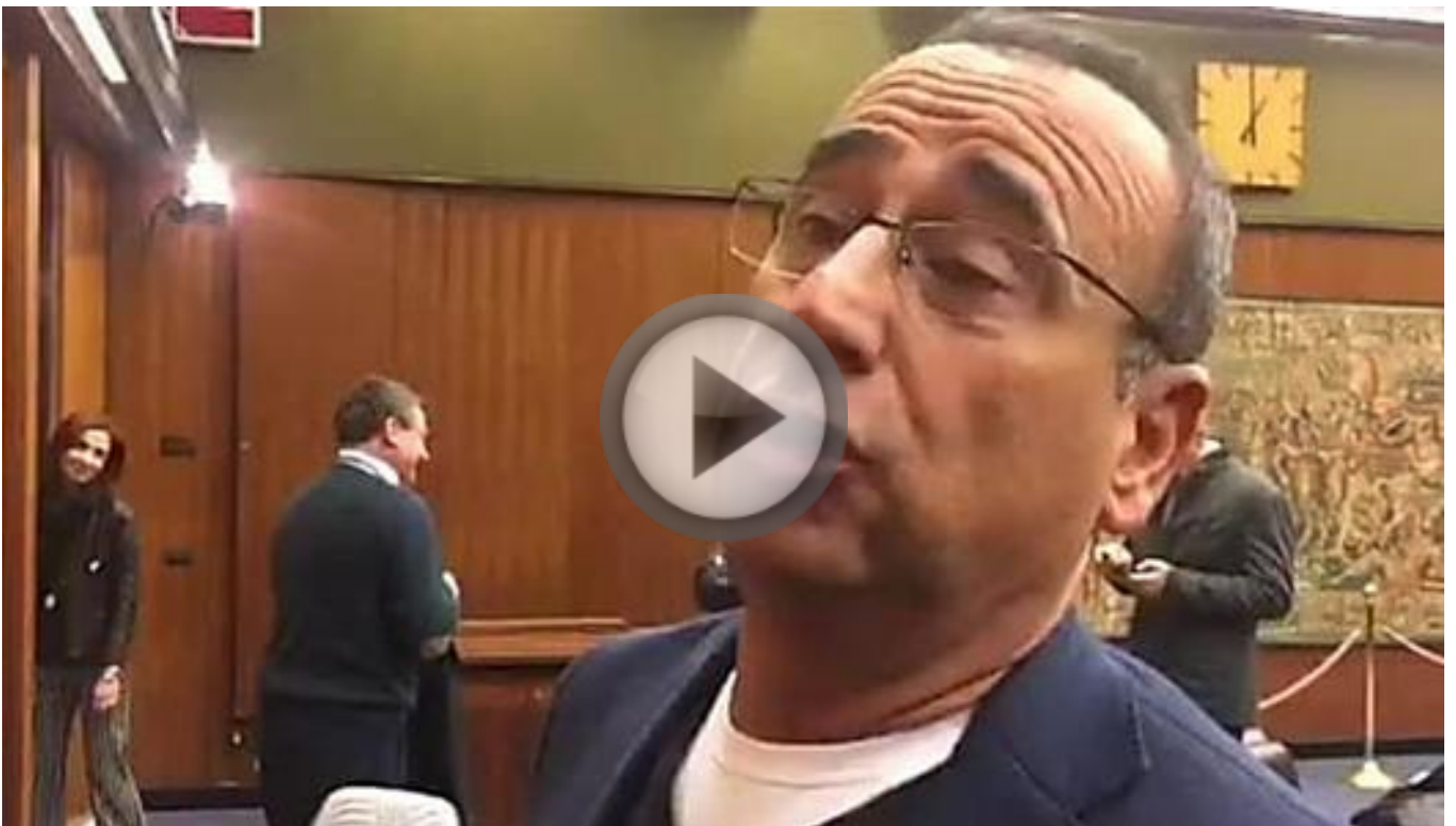
carlo Conti e lo Zecchino d'Oro